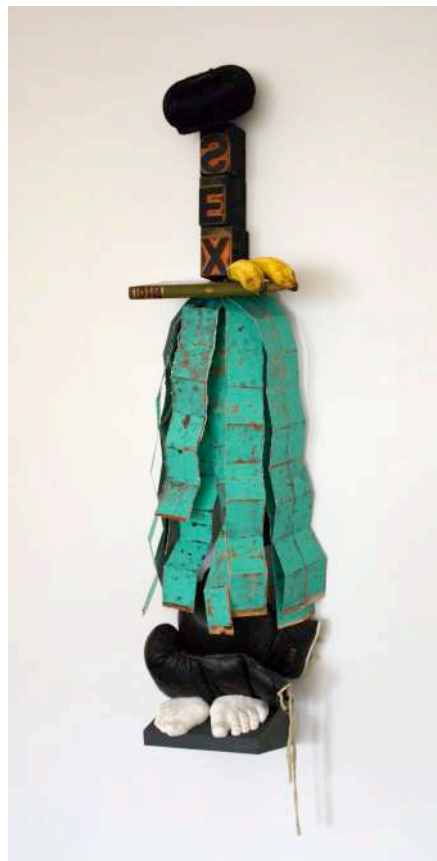
Temps de rêve , 2015, Sculpture d'objets variés assemblés, 120x36x28 cm

Présentant des acryliques sur papier, des dessins à l'encre de chine, des objets variés assemblés en sculpture ou encore des livres d'artiste, l'artiste nous offre une immersion jubilatoire dans son univers. Le travail se développe autour de trois axes principaux : la calligraphie, l'anthropomorphisme et le rapport à la mémoire. A la manière d'un collage, les divers éléments de vocabulaire artistique s'articulent, se juxtaposent, fusionnent parfois, sous des couleurs monochromatiques intenses comme le rouge ou le vert. En quête d'identité, Cardenas-Castro dépeint une vision systémique où tout serait lié, laissant le spectateur en découvrir le mystère.